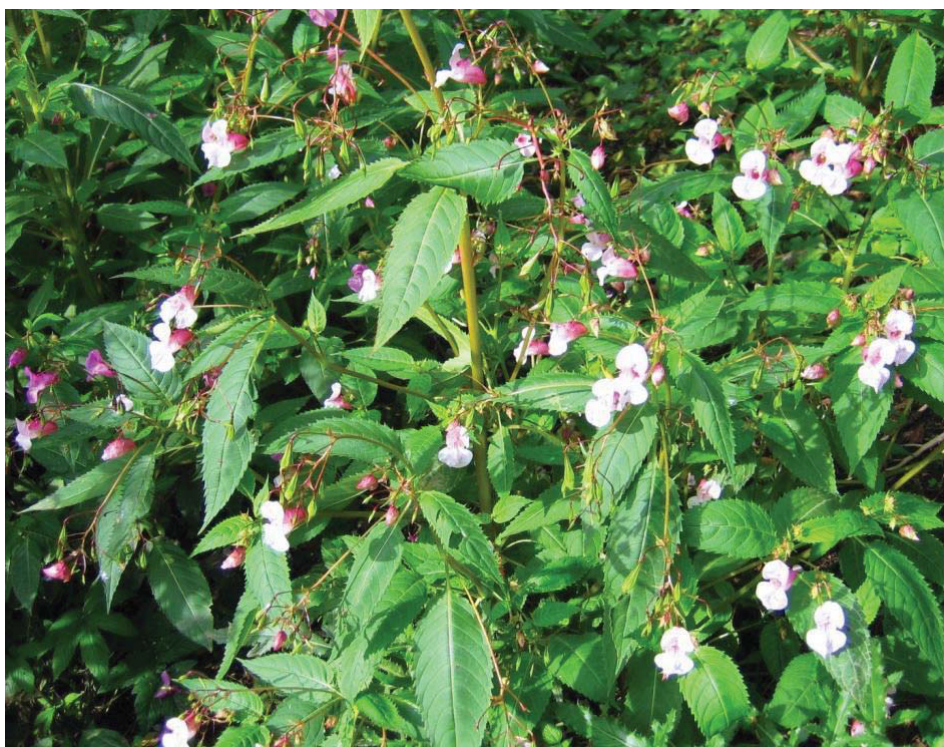
jättipalsami ( Impatiens glandulifera Royle)

Kun teet keväällä siistimistöitä otathan huomioon lintujen mahdollisen pesinnän alueella.