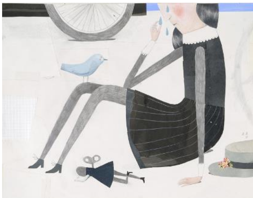
Marika Maijala, Siivetön, sekatekniikka.