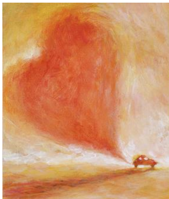
Liisa Kallio, Rakas auto, akryyli.