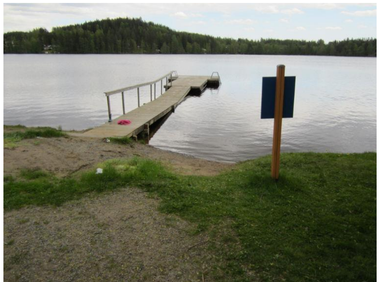
Orijärven uimarannan laituri.

*) ID-tunnus ja tarkistetut koordinaatit Valviran vuoden 2021 uimarantaluettelosta.