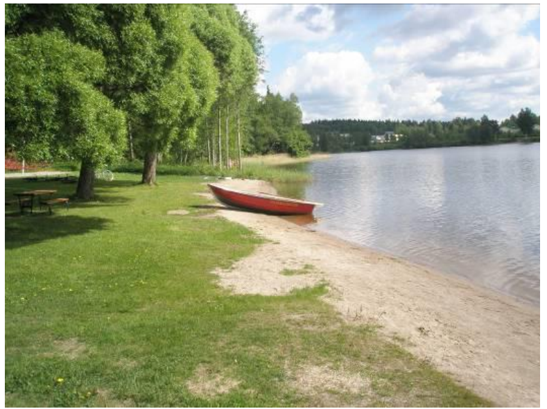
Orijärven uimarannan hiekkaranta ja pelastusvene.